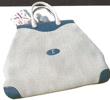
クロコ革つかいがにくい、夏の日のためのバッグ——「Bag in the Scenery」より。